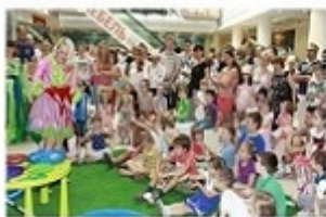
Праздник в Торговой галерее «Монарх»