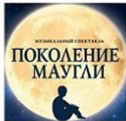
Совместный проект Фонда и компании МТС