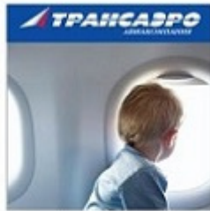
Программа «Привилегия Добра», реализованная вместе с авиакомпанией Трансаэро

Благотворительная акция Фонда и интернет- издания «Из рук в руки»