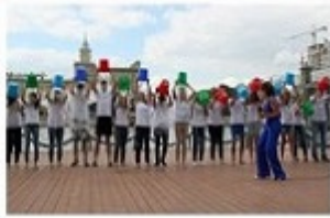
Ice Bucket Challenge в парке Горького