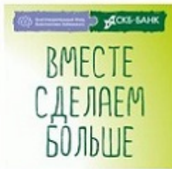
Совместная программа Фонда и СББ банка