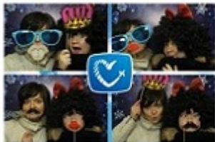
Рождественская ярмарка журнала Seasons of Life