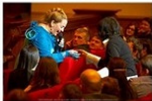
Сбор средств на концертах